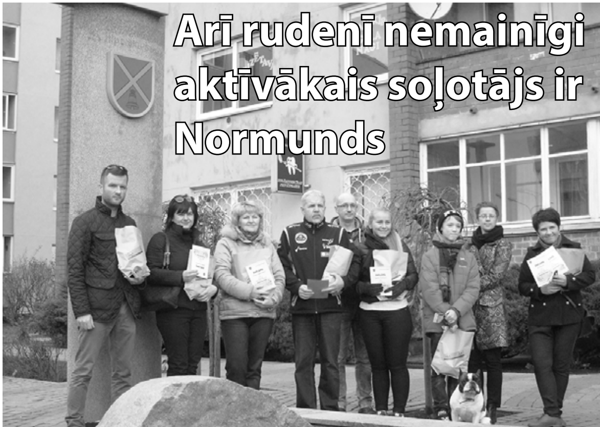
Uzvarētāju apbalvošana notika 14. novembrī. Balvas saņēma aktīvākie, kā arī citi klātesošie endomondo dalībnieki.