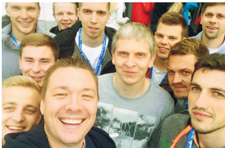
Šovasar kopā ar BK Dartija komandu Somijā.

vari spēlēt ar visu atdevi, jāsāk domāt - kam tas viss? Tituls ir izcīnīts, nav vairs, uz ko tiekties, vajadzētu beigt, bet nevaru, jo tas basketbols ir dziļi sirdī. Tomēr centīšos pieturēties pie principa – kamēr vari, spēlē, bet, kad tevi sāk apspēlēt un apskriet, jāiet prom. Jau tagad divaini jūtos, kad laukumā jāspēlē ar sešpadsmitgadīgiem. Veterāni gan spēlē arī 70 gadu vecumā.