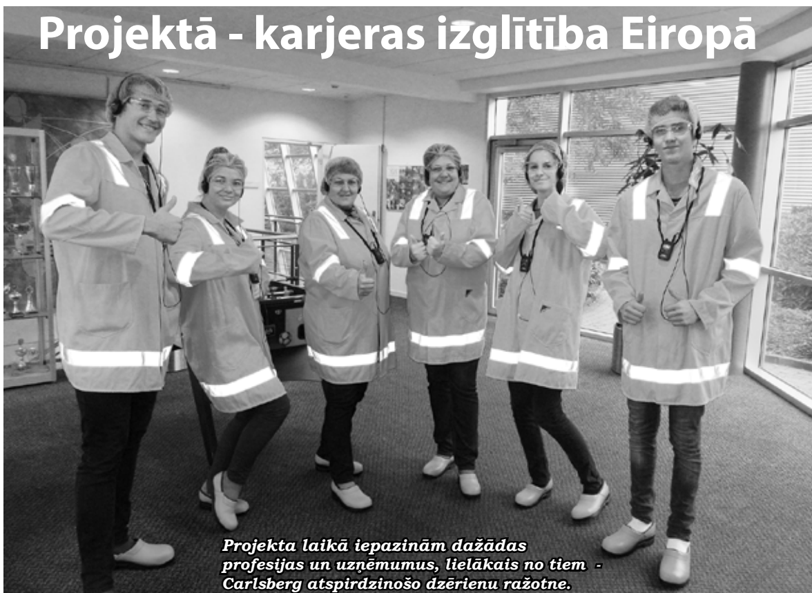
Projekta laikā iepazīnām dažādas profesijas un uzņēmumus, lielākais no tiem - Carlsberg atspirdzinošo dzērienu ražotne.