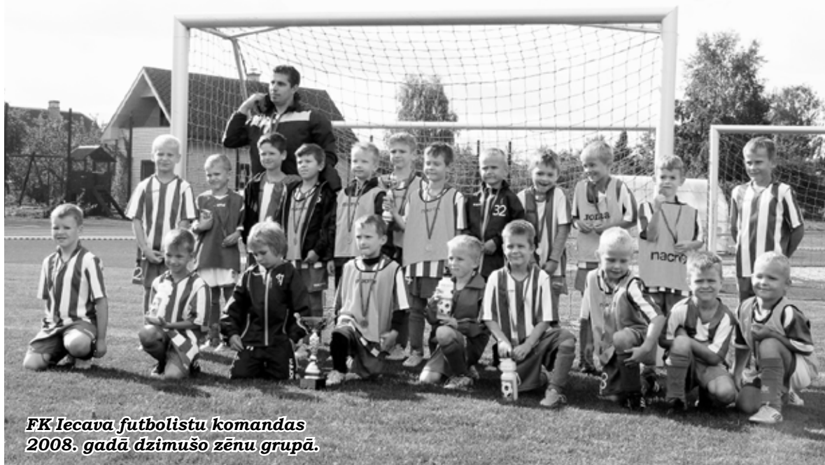
FK Iecava futbolistu komandas 2008. gadā dzimušo zēnu grupā.

13. septembrī, tieši pretēji, sacentās vecākie futbola audzēkņi - 2003. gadā dzimušie un jaunāki zēni. Šim vecumam nācās pirmo reizi piedalīties lielajā futbolā 11:11, kur par kausu savstarpēji cīnījās divas JFA Jelgavas komandas, FK Iecava un JFC Dobeles . Arī šajā vecumā par uzvarētājiem kļuva viesi, bet par