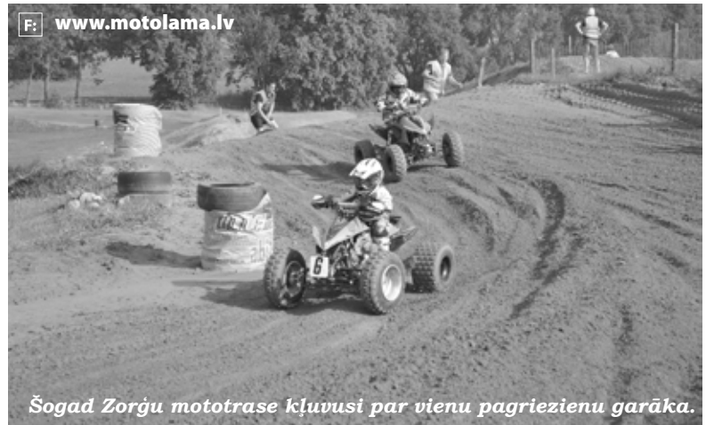
Šogad Zorģu mototrase kļuvusi par vienu pagrieziena garāka.