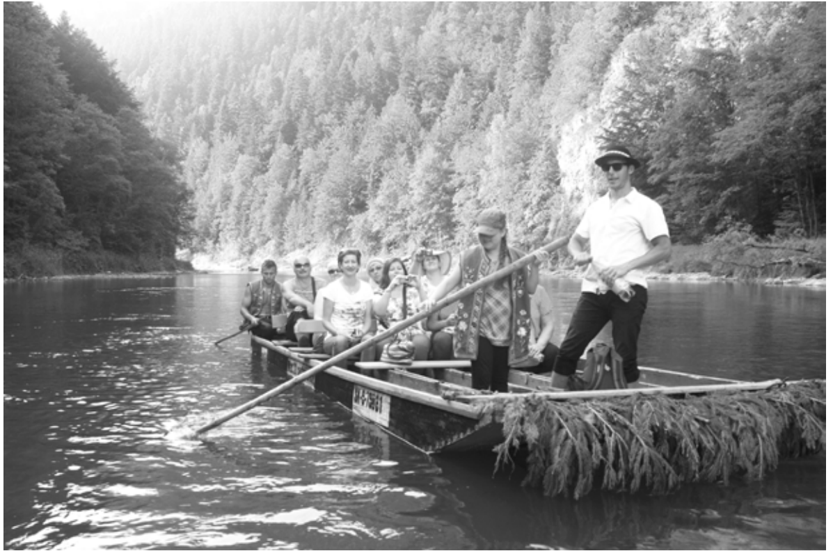
Neaizmirstams brauciens pa Dunajecas upi.

Tad sekoja dienas atraktīvākā daļa - brauciens ar plostiem pa