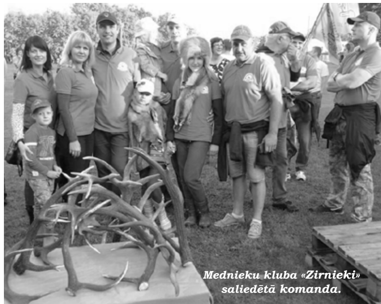
Mednieku kluba «Zirnieki» saliedētā komanda.