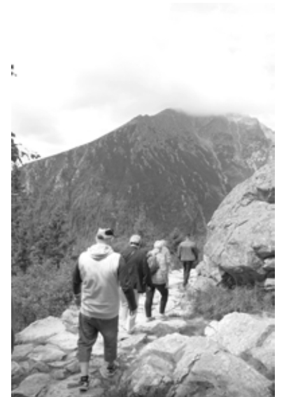
Kalnu taka Augstajos Tatros.

Nākamajā dienā gide, kura pirms 25 gadiem Slovākijā ieradusies no Baltkrievijas, mūs ie-