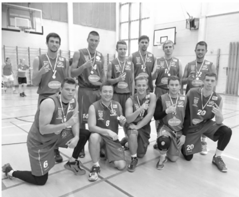
BK Dartija komandas puīšus pretī uzvarai virzīja prasme vajadzīgajos brīžos izrādīt saliedētību un cīņas sparū.