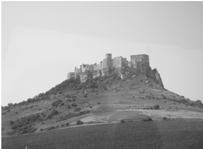
Iespaidīgais apskates objekts – Spiškas cietoksnis.