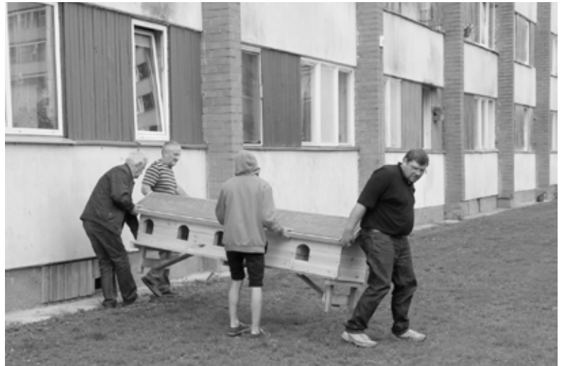
Viena no kaķu mājiņām tika novietota pie daudzdzīvokļu nama Sporta ielā 1. Līdzšinējā pieredze rāda, ka kaķi labprāt tajās uzturas, īpaši vēsajos gadalaikos, kad nepieciešams patverties no vēja, lietus, sniega un aukstuma.