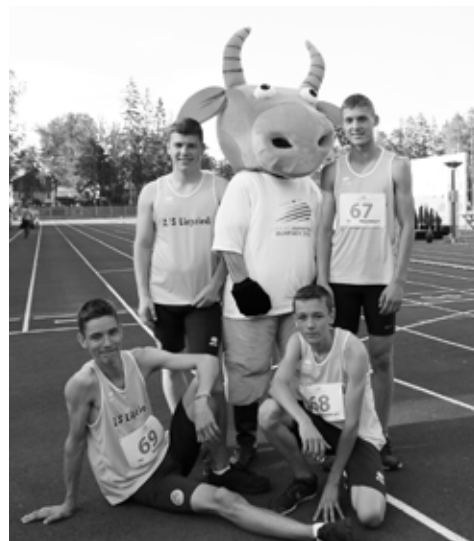
Stafetes komanda Valmierā kopā ar vienu no olimpiādes talismaniem – vērsēnu Voldiņu. Cēsis sportistus uzmundrināja otrs talismanis - sikspārnēns Valters.

Pašvaldība priecājas par mūsu olimpisko sasniegumiem un pateicas visiem sportistiem un viņu treneriem, kas lika izskanēt Iecavas novada vārdam Latvijas Jaunatnes olimpiādē. IZ