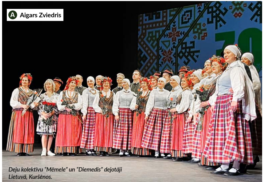
Deļu kolektīvu “Mēmele” un “Diemedis” deļotāji Lietuvā, Kuršēnos.