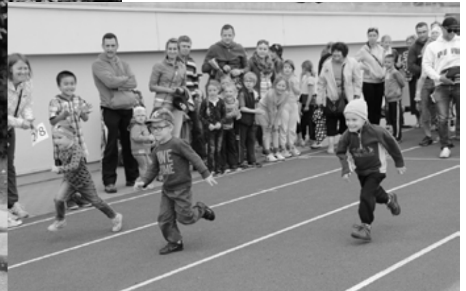
Vairāk foto - portālā www.iecava.lv