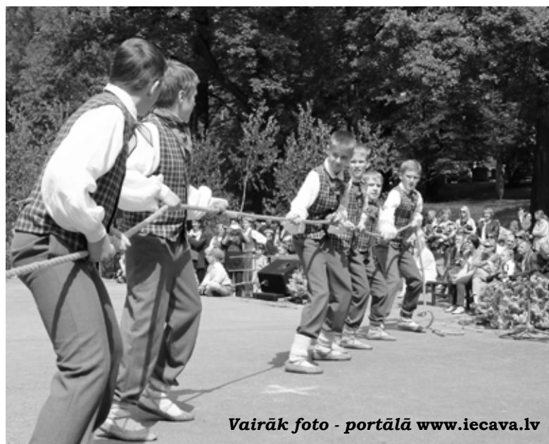
Vairāk foto - portālā www.iecava.lv