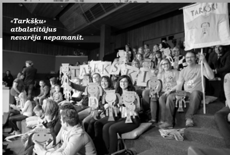
«Tarkšķu» atbalstītājus nevarēja nepamanīt.