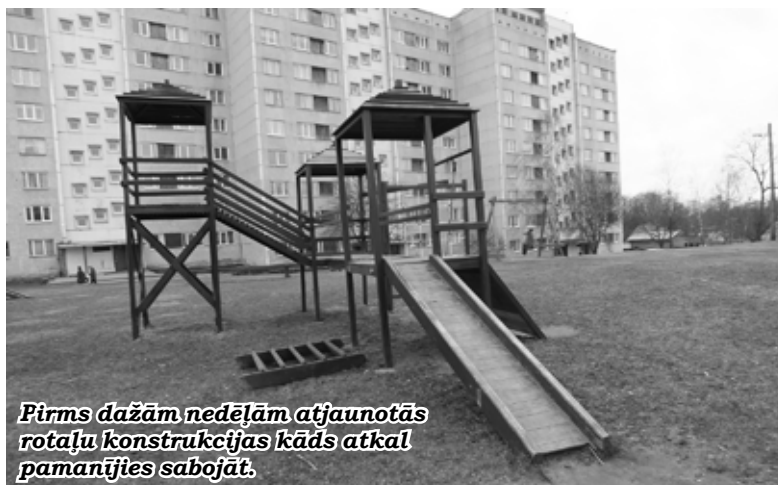
Pirms dažām nedēļām atjaunotās rotaļu konstrukcijas kāds atkal pamanījies sabojāt.