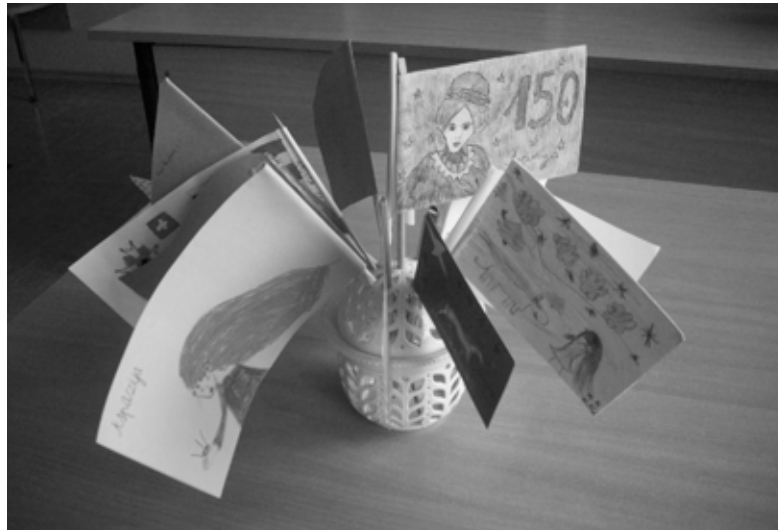
Konkursantu izveidotie Aspazijas un Raiņa karogi.

2) izveidot Aspazijas karogu un Raiņa karogu.