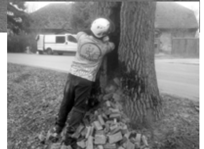
Satrupējts oša stumbrs.

brā bija trupe un sala plaisas, bet vainaga daļā daudz atmirušu zaru – aptuveni 70-80 procenti. Sākumā cerējām, ka varēsīm to saglabāt, bet, apskatot rūpīgāk, sapratām, ka tas nebūtu droši. Tāpat tika nozāģēta divstumbra liepa pie aptiekas. Viens no tās stumbriem bija pilnībā satrupējies, otrs – par aptuveni 60 procentiem dzīvs, bet bīstams. Tā kā koks atradās tuvu krustojumam un vietā, kur pārvietojas daudz cilvēku, pieņēmām lēmumu to nozāģēt. Arī otrai liepai sakņu kakliņa rajonā ir trupe, ko izraisījusi kādreiz veikta galotņošana, taču pagaidām koks nav bīstams. Divus ošus nācās nozāģēt arī Upes ielā. Viens no kokiem turējās tikai uz mizas,