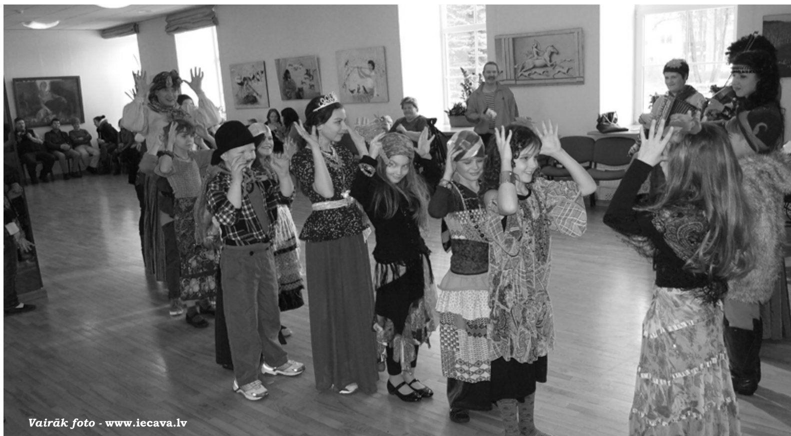
Vairāk foto - www.iecava.lv