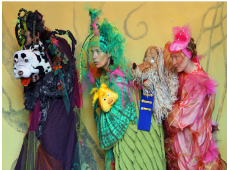
Skats no jaunā koncertuzveduma «Viens, divi, trīs – nu Tu esi brīvs!».