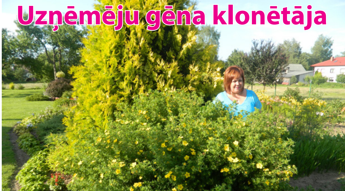
Brīvā laika aizraušanās – dārzs.