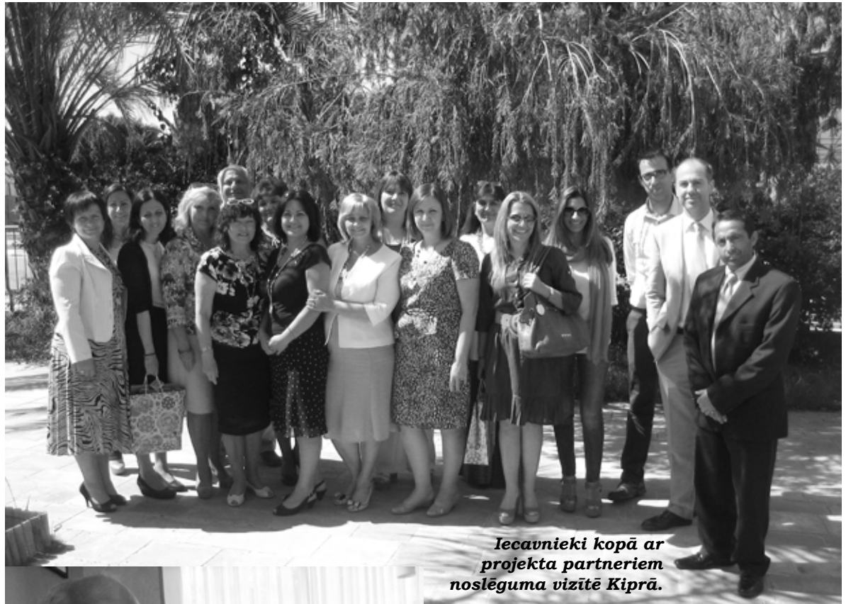
Iecavnieki kopā ar projekta partneriem noslēguma vizītē Kīprā.