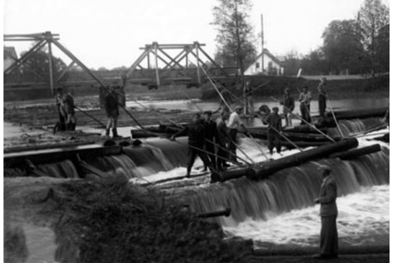
Koku pludinātāji uz Augšas dzirnavu dambja. Ap 1930. gadu.