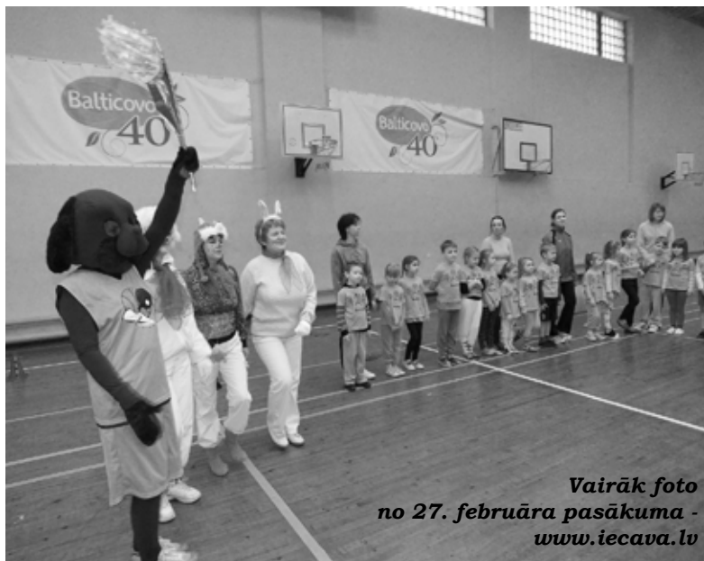
Vairāk foto no 27. februāra pasākuma - www.iecava.lv