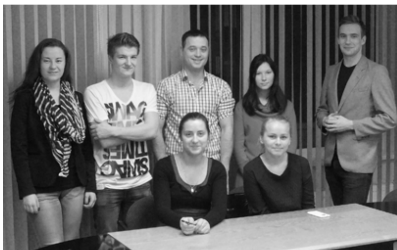
Jauniešu konsultatīvās padomes pirmās sanāksmes dalībnieki.

Padomes sastāvā ietilpst jaunatnes lietu speciālists, četri novada skolu, pieci nevalstisko organizāciju, divi neformālo jauniešu apvienību pārstāvji. Uz sanāksmēm, atkarībā no jautājumu specifikas, aicinās arī kādu no domes deputātiem. Darbojoties padomē, jauniešiem ir jāizstrādā priekšlikumi par politiskiem, ekonomiskiem,