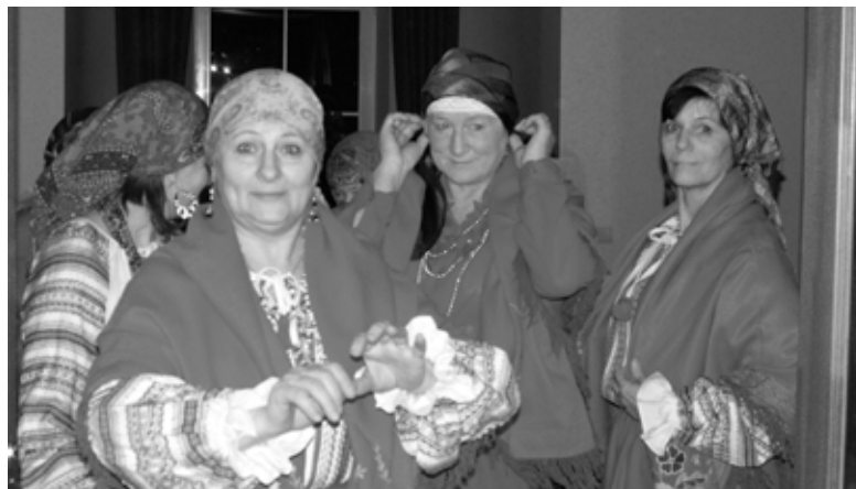
Senioru deju kolektīva dalībnieces kā «Buranovskiye Babushki».

Šajā zvaigžņu plejadē varēja vērot Renāra Kaupera populāro priekšnesumu «Joka pēc alfabēts» (jauktais koris), Balto kori ar dziesmu «Gas-gas» (vidējās paaudzes deju kolektīvs), izcilu