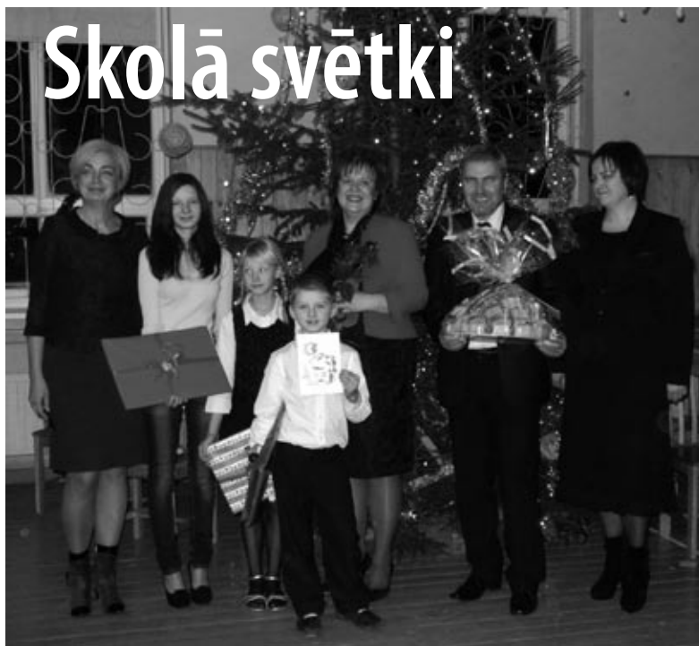
Valsts kontrolieres komanda kopā ar apsveikuma kartītes autoriem.