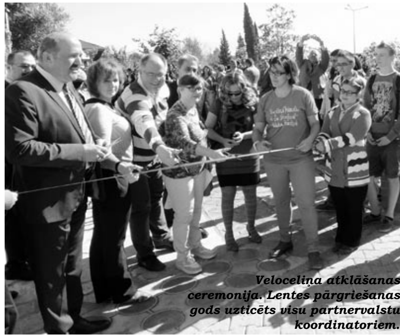
Veloceliņa atklāšanas ceremonija. Lentēs pārgriešanas gods uzticēts visu partnervalstu koordinātoriem.

Projekta «Cycling Europe» galvenie sasniedzamie mērķi saistīti ar cilvēku iespējām dzīvot veselīgu dzīvesveidu, veidojot draudzīgu vidi. Kā galvenais uzdevums izvirzīts velobraucēšanas veicināšanas kampaņu realizēšana. Katrā valstī tiek organizēts kopīgs valstu pārstāvju velobrauciens, notiek vizīte vietējā pašvaldībā, lai rosinātu pārdomāt iespējas izbūvēt jaunus veloceliņus un velonovietnes. Skolēni izstrādā velomaršrūtus, vēro velonovietņu izvietoj-