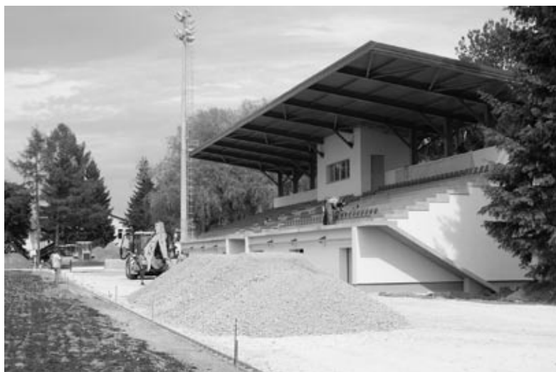
Tribīnēs zem nojumes būs sēdvietas vairāk kā 400 skatītājiem.