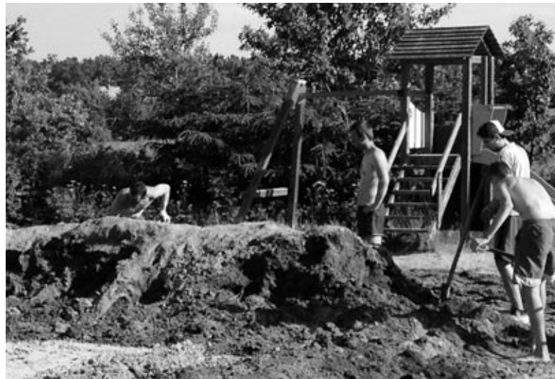
Laukuma būvniecībā aktīvi iesaistījušies arī citi Dimzukulna iedzīvotāji.