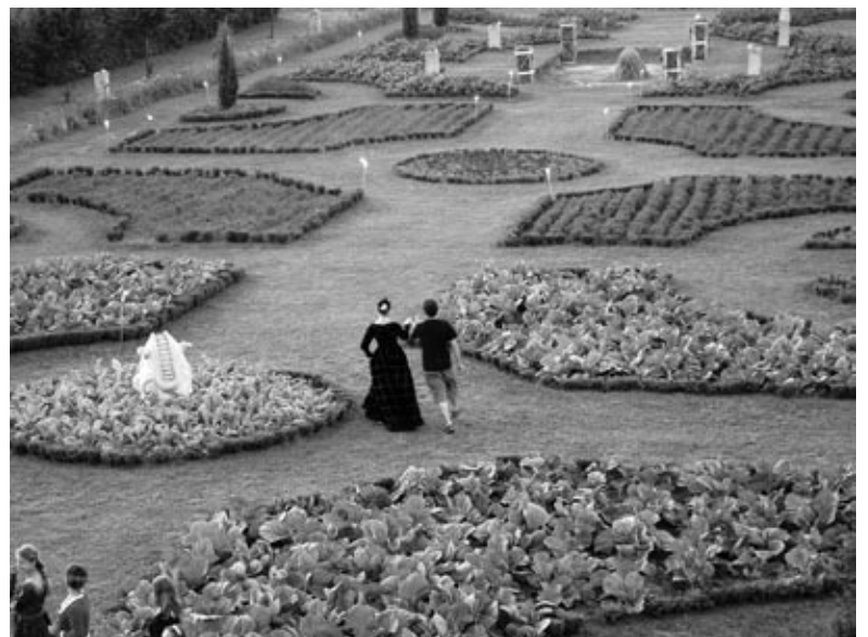
Renesanses dārzs priecē muižas iemītniekus un viesus.