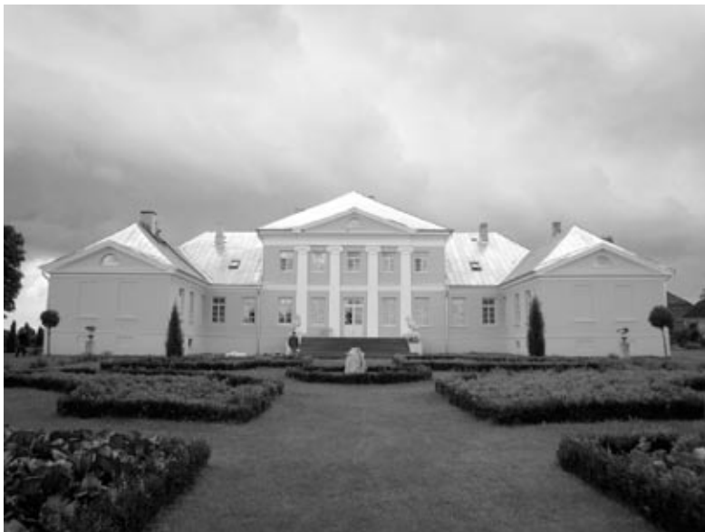
Atjaunotā Bruknas muižas ēka.