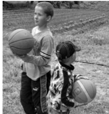
Audrupu jaunie basketbolisti.

Iecavas sieviešu klubs «Liepas» valdes locekle