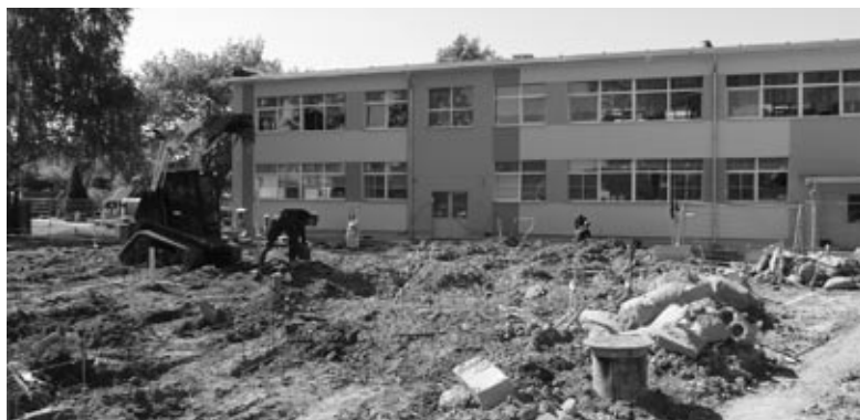
PII «Cālītis» ziemeļrietumu pusē top piebūve trijām bērnudārza grupām.

Būvniecības darbu dēļ piekļūšana bērnudārzam šobrīd ir iespējama tikai no Zemgales ielas puses. Tas varētu ilgt līdz septembrim, jo par būvdarbu veikšanu pašvaldība noslēgusi līgumu ar SIA «NEWCOM Construction» par Ls 445 923,79 uz laiku no 25. marta līdz 25. au-