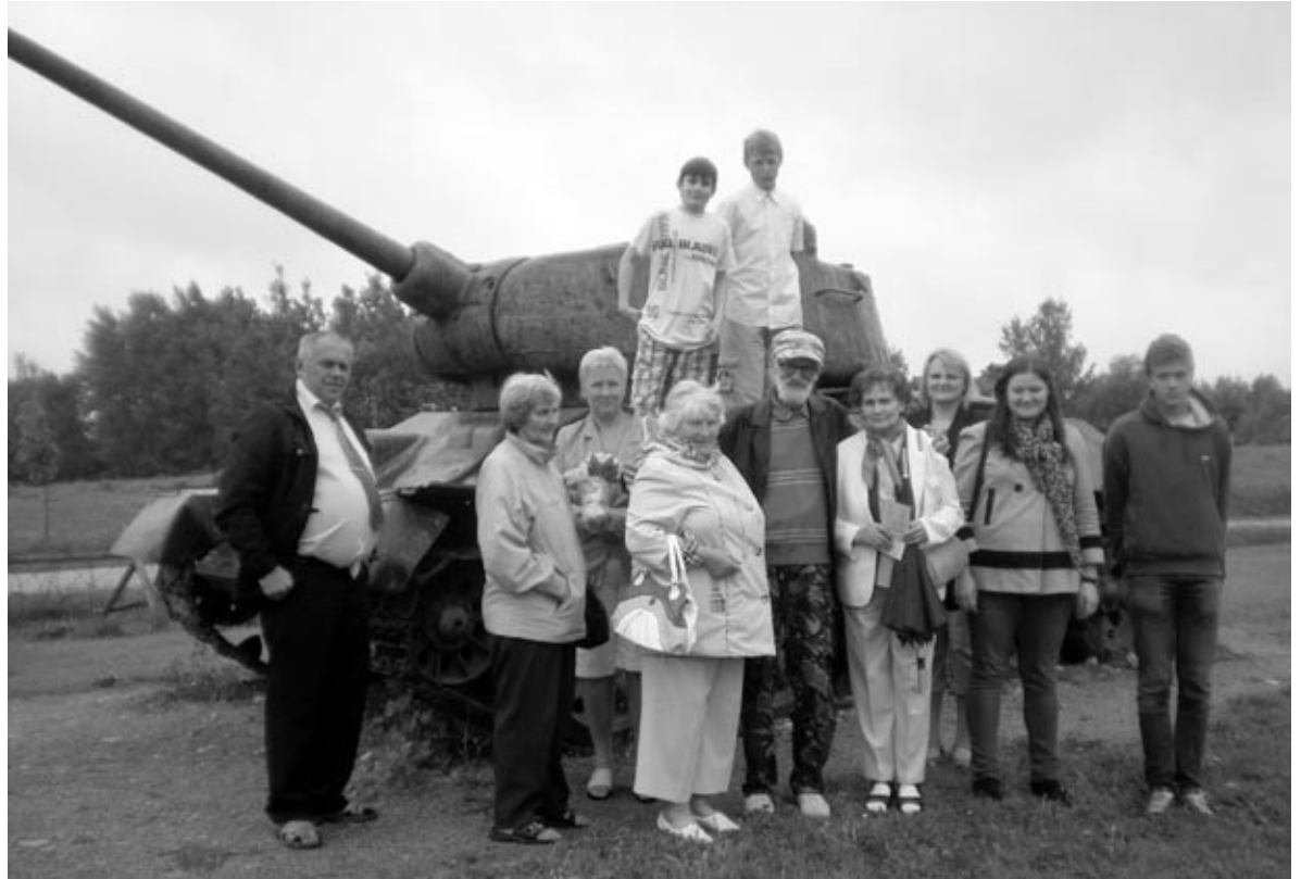
Mores muzejā var apskatīt kartes, šautenes, šāviņu šķembas un citus priekšmetus, bet mūs sagaida arī Ērgļu kauju liecinieks - tanks.

No aukstās pazemes ir patīkami atgriezties autobusā, lai brauktu uz Mores kauju atceres pieminekli un muzeju. Mores kaujas ir Vidzemes asiņainākās kaujas. Tās sākās 1944. gada 25. septembrī, un no 5. uz 6. oktobri tika saņemta pavēle atkāpties. 6. oktobrī padomju armijas daļas uzbruka tukšām