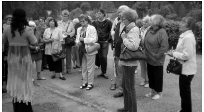
Skaistajā Līgatnē, kas lepojas ar saviem tiltiņiem, klintīm, klinšu pagrabiem un vecajām celtnēm.

Atvadāmies no skaistā meža, lai dotos uz ģimenes uzņēmumu Skrīveros - saldējuma ražotni, kas strādā jau sešus gadus. Saldējumu gatavo trīs dienas. Visas izejvielas ir vietējās. Uzņēmums radījis biežpiena saldējumu un dažus sāļos saldījumus. Igaunijas prezidents Tomass Hendriks