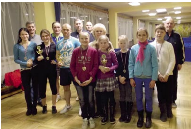
Iecavas novada čempionāta galda tenisā godalgoto vietu ieguvēji.

Sabiedriskā labuma organizācija biedrība «Iecavas sieviešu klubs «Liepas»» sadarbībā ar SIA «M» aicina iecavniekus palīdzēt, ziedojot jaunai sievietei, kurai nepieciešamas neparedzētas finanses C hepatīta ārstēšanai.