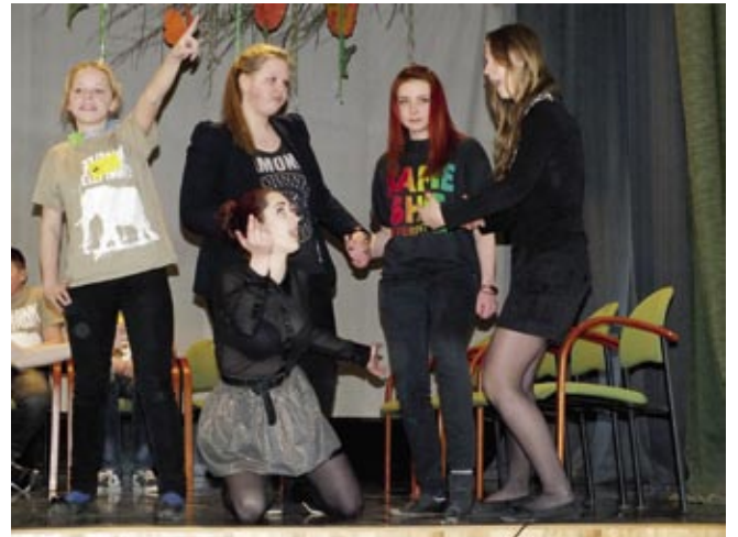
Iecavas vidusskolas 9. klašu komanda.