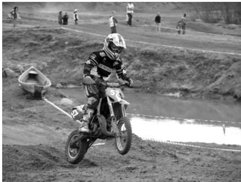
Burtnieku mototrasē 2011. gadā.

Motokross – tie ir putekļi, dubļi, sāpīgi kritieni un arī sāpīgi brīži, kad pēdējā aplī, esot līderim, nojūdzas mocis. Vai mirkli, kad, redzot trampļina lēcienā savu bērnu, mammai un tētim uz mirkli aizraujas elpa un pamirst sirds. Taču tas ir arī uzvaras prieks, adrenalīns un pozitīvu emociju gamma.