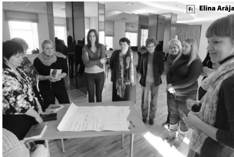
Seminārā par brīvprātīgo darbu dalībnieki izvērtēja, ko varētu gūt iestāde no jaunieša un ko - jaunietis no iestādes.

Likumdošana paredz, ka brīvprātīgo darbu var veikt valsts un pašvaldībās iestādēs, kā arī nodibinājumos un biedrībās. IZ