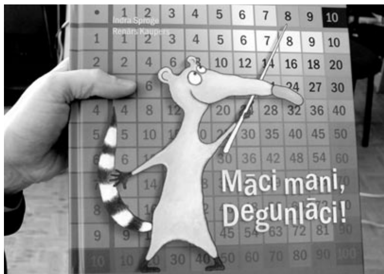
Grāmatā ilustrētas visas 55 reizrēķina izteiksmes. Komplektā ir arī CD ar animācijas filmiņām.

Iemācījušies lasīt, bērni ķērās pie alfabēta mācīšanās, izmantojot grāmatiņu «Joka pēc alfabēts».