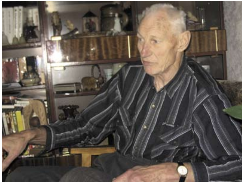
Visvalža atmiņās un bilžu albumos ir tik daudz stāstu, ka, tos uzklausot, varētu ciemoties pie viņa vairākas dienas.

Es jau par sportu interesējos: Sportiņu pasūtīju no 1954. gada. Bet televīzijas jau mums tur laukos nebija, nezināju, kas īsti tas basketbols ir. Bērībā spēlējām futbolu, volejbolu, ziemā slēpo-