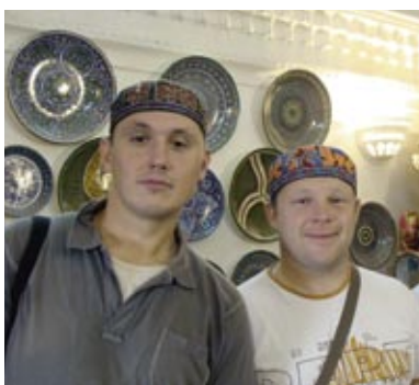
2008. gadā Uzbekistānā.