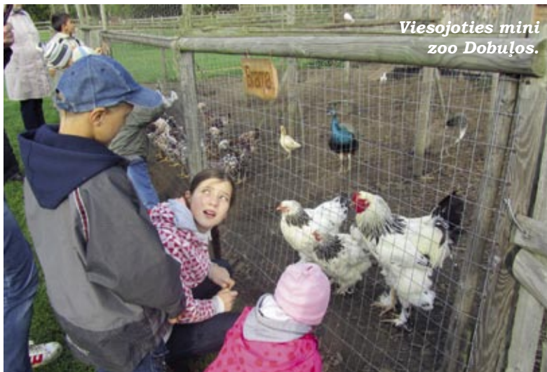
Viesojoties mini zoo Dobuļos.