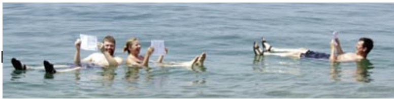
Peldoties Nāves jūrā 2011. gadā.