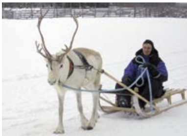
Somijā pie polārā loka 2008. gadā.