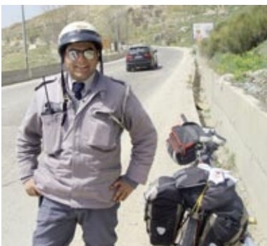
Policijas eskorts Libānā 2011. gadā.