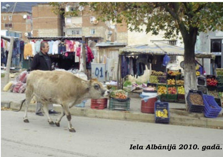
Iela Albānijā 2010. gadā.