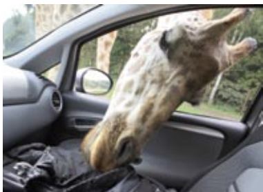
Kārumniece žirafe 2011. gadā Brēmenē.