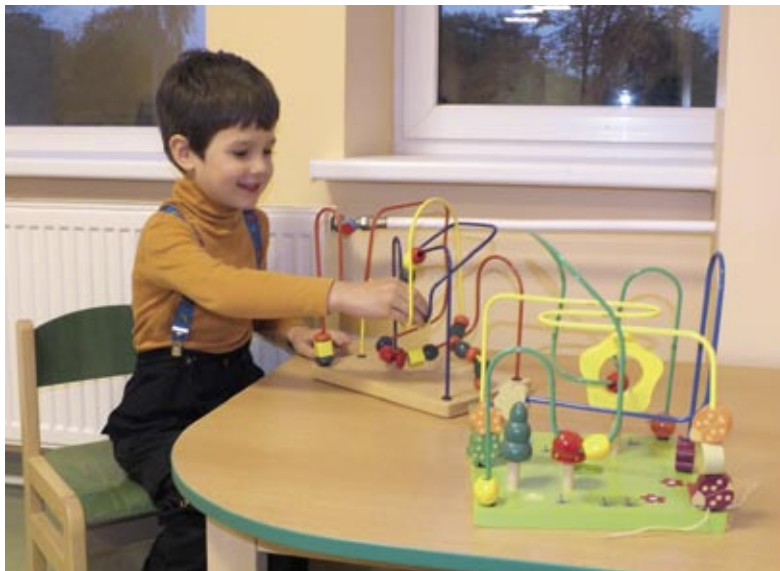
Mazie pacienti, gaidot ārsta vizīti, varēs spēlēties ar attīstošām rotaļlietām.

niem saprotamā veidā. Atkarībā nepieciešamību (piem., pret ērcu no sezonas plānots informēt par encefalītu) un profilaktiskajiem dažādu vakcīnu lietderību un pasākumiem. [Z]