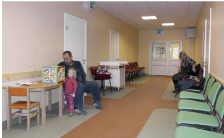
Gaitēna krāsainais interjers un aprīkojums bērniem novērsīs domas no gaidāmās ārsta vizītes, bet kontrastainās krāsās ieklātais grīdas segums gaitenī palīdzēs vājredzīgajiem pacientiem orientēties telpā.