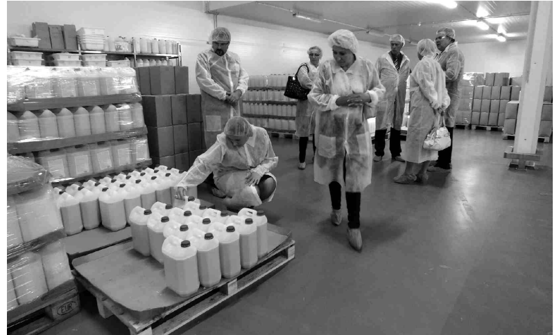
Pasākuma dalībniekiem bija iespēja paviesoties jaunajā šķidro olu cehā un arī gatavās produkcijas noliktavā.

olu cehs jau pašlaik ir labākais pasaulē - automatizēts, moderns un kvalitatīvs. Pieņēmums nesot viņa, bet gan sadarbības partneru. Arī jauda ir iespaidīga - stundā tiek saražotas piecas tonnas šķidrās olu masas. «Šodien dēta ola uzreiz tiek pārstrādāta olu masā un iepakota, tādēļ ar konkurētspējīgu realizācijas termiņu un augstu kvalitāti,» tā Kovaļčuks. Arī vārīto olu cehs ir automatizēts, un tajā stundas laikā tiek izvērtēti, atdzesēti, noloģoti un iepakoti 25 tūkstoši olu. «Neskatoties uz kopumā pesimistisko noskaņojumu valstī, «Balticovo» pierāda, ka arī šajā