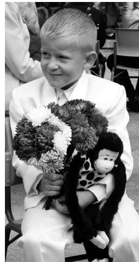
Internātpamatskolas pirmklasnieki dāvanā saņēma mīksto mantiņu.