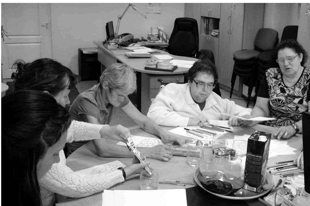
Pēc mielasta dalībnieki izvēlējās sev tīkamāko mandalu un, to krāsojot, domāja par saviem dzīves mērķiem un vēlmēm, cerot, ka tās piepildīsies.

mes, palielinātu to nodarbinātību un integrāciju sabiedrībā. Pavisam projekta piecās mērķgrupās plānots iesaistīt 70 dalībniekus: pirmspensijas un pensijas vecuma personas; vecākus, kuriem ir bērns invalīds; personas, kuras kopj slimu ģimenes locekli; personas ar fiziska rakstura traucējumiem. Par pensijas vecuma personu grupas darbosanos Zorģu bibliotēkā «Iecavas Ziņas» rakstīja aprīlī un jūlijā. □