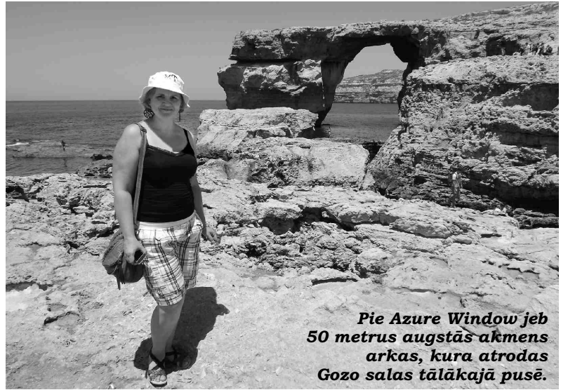
Pie Azure Window jeb 50 metrus augstās akmens arkas, kura atrodas Gozo salas tālākajā pusē.

Otrā ekskursija veda uz mūsdienu Maltas galvaspilsētu Valletta , kurā vērojām gan burvīgus skatus no augšas uz lielajām ostām un klinšainajiem Maltas krastiem, gan greznus dievnamus. Vakariņās Vallettā notika īpašā maltiešu restorānā, kur pirms maltītes vairākiem interesantiem, tostarp man, bija iespēja piedalīties vietējās nacionālās virtuves ēdiena sagatavošanā. Iepazināmies ar īpašās maltiešu receptes maizes cepšanu, kā arī paši veidojām picai līdzīgu izstrādājumu, kurš gan garšoja pavisam atšķirīgi un ļoti garšīgi! Turpinājumā nobaudīju vēl kādu nacionālo ēdienu - truša sautējumu, piedzerot klāt vietējo at-