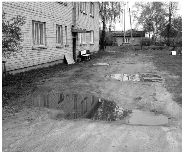
Pagalma dubļu peļķes pirms projekta.

Jau šobrīd «Rosmes 8» iedzīvotājiem un iebrāucējiem pavaras pavisam cits skats - uzlabots