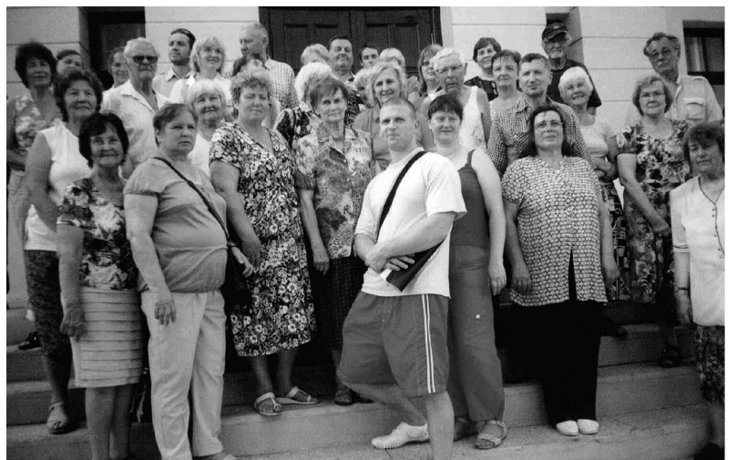
Gulbenes dzelzceļa stacijā kopā ar gidu, kura atraktīvajā stāstījumā ekskursanti klausījās ar lielu interesi.

Tālāk Jaungulbene, kur iecavnieki pie pils iespaidīgajiem vārtiem, kur mūsu skatam atklājas bijušās greznās pils nožēlojamā postaža. Pils gide ir fanātiska pils vēstures un īpašnieku dzīves likteņu izzinātāja. Senās fotogrāfijās atspoguļoti neticami greznais telpu interjers un pils īpašnieku jaunākās paaudzes likteņi. Tagadējie «īpašnieki» - protams - Rīgā, kuri nenes nekādu atbildību par brūkošo ēku, par nekopto parku. Lauksaimniecības skolas laikā pils telpās ar parketa grīdām samontēts kombains. Kad tas darbināts, visa pils drebējusi. Žēl «skumjās, netūrās lauvas», kuras vēl it kā