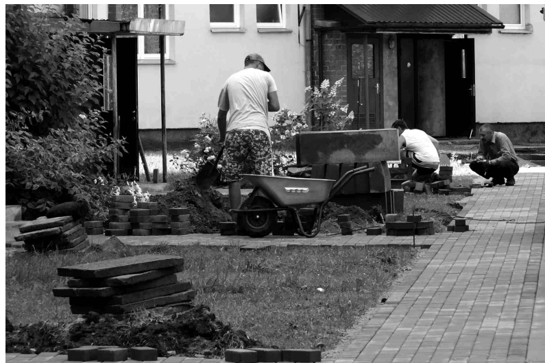
Labiekārtošanas darbi pirms projekta noslēguma, lai Ozolu ielas 15 mājas iedzīvotāji varētu pārvietoties drošāk.