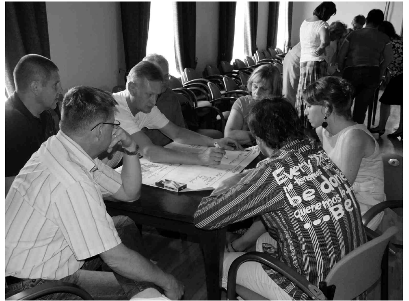
Darba grupa, analizējot scenāriju «Industrija», diskutē par svarīgākajiem darbiem, kurus būtu nepieciešams veikt.