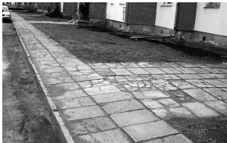
Daudzdzīvokļu ēka Ozolu ielā 15 ir celta 1989. gadā; celiņi pie tās bija fiziski un morāli novecojuši, apdraudēja iedzīvotāju un blakus namu iemītnieku veselību.

Šogad apstiprināto piecu projektu īstenošanai Nīderlandes KNHM fonds atvēlējis Ls 1738,15, Iecavas novada Dome - Ls 868,38, projektu darba grupas - Ls 1393,58. ☒