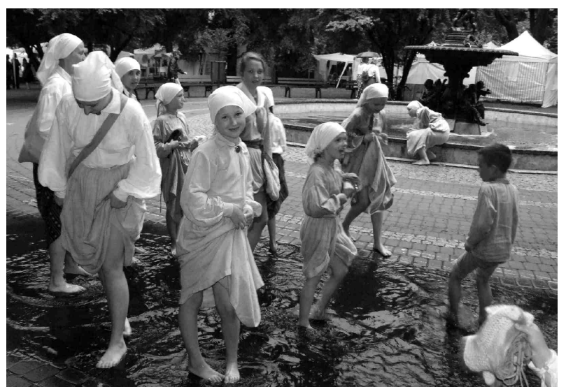
«Tarkšķi», veldzējoties peļķēs pēc negaisa Vērmanes dārzā.