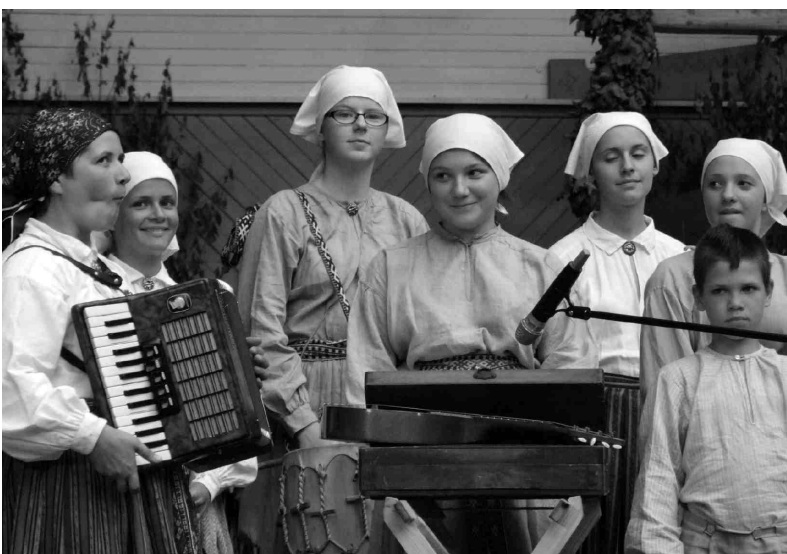
«Tarkšķi», koncertējot vairāku stundu garumā Vērmanes dārzā.

Žēl, ka «Tarkšķiem» izpalika pēdējā – noslēguma - diena Madonā, bet varbūt arī labi, jo, šķiet, bērnu spēku, tīro blūzu un lakatiņu resursi bija izsmelti. Pēc trim gadiem, tad gan iesim uz pilnu klapi! IZ