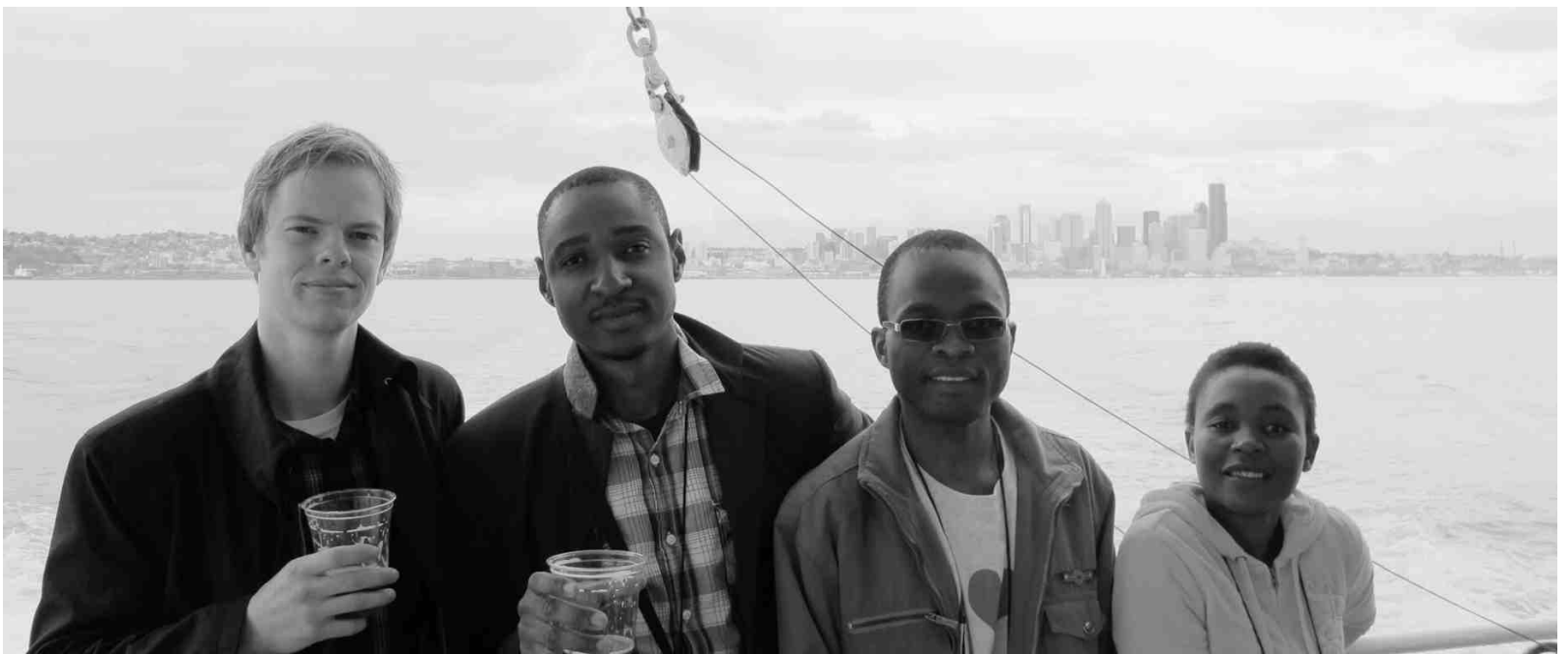
Lielisks veids kā atpūsties kopā ar citiem «Fulbright» stipendiātiem no Burkinafaso, Zimbabves un Angolas ir izbrauciens ar kuģi pa Kluso okeānu Sietlas krastā.

«Kopumā meklēt iespēju studēt vai pastrādāt kādu laiku ārzemēs noteikti iesaku katram. Tas dod neatsveramu pieredzi, valodu zināšanas, jaunus draugus un iespēju ceļot. Amerikā kopumā par sliktu stilu tiek uzskatīta vairāku grādu iegūšana tajā pašā universitātē. Tas tāpēc, ka no katras vietas un katra pasnieiedzēja iespējams paņemt to labāko un doties tālāk. ☒ 3.lpp.