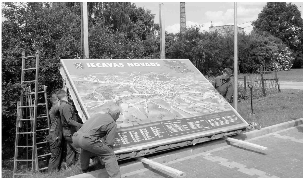
Iecavas novada grafiski māksliniecisko karti ar trīsdimensiju elementiem veidoja uzņēmums SIA «Baltijas dizaina aģentūra». Kartes izmaksas mērāmas 2400Ls (bez PVN).