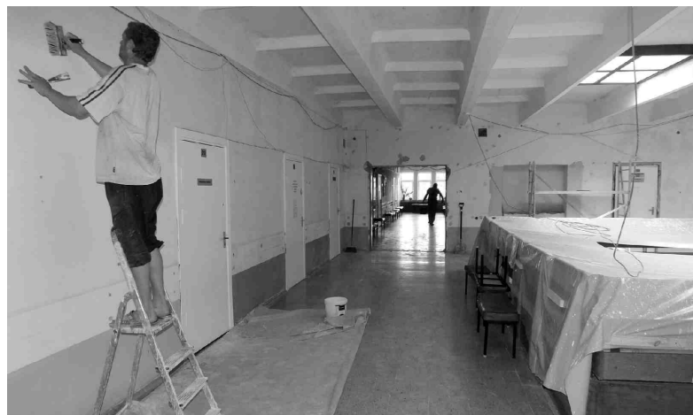
Iecavas veselības un sociālās aprūpes centra foajē 2. stāvā skats uz 1. stāvu ir segts plēvē: meistari špaktelē un krāso sienas.

Iecavas novada Sociālā dienesta kolektīvs