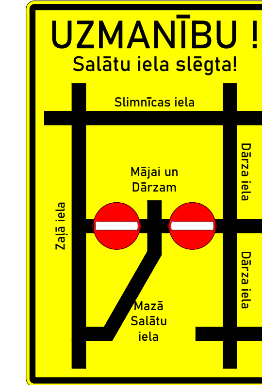
Apvedceļu plakāts Nr.3