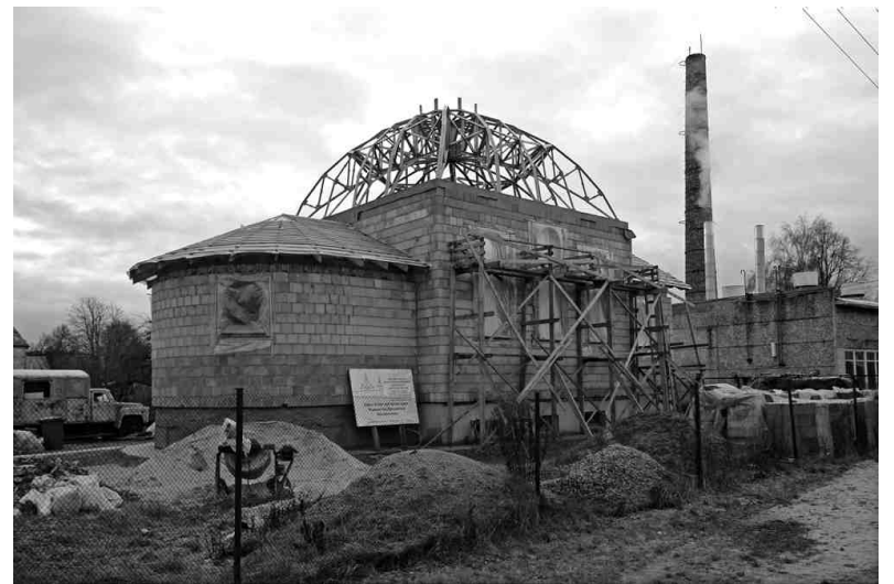
Celtniecības konstrukcijas jau iezīmē topošā dievnama aprises. Baznīca top, pateicoties ziedojumiem un cilvēku brīvprātīgajam darbam.