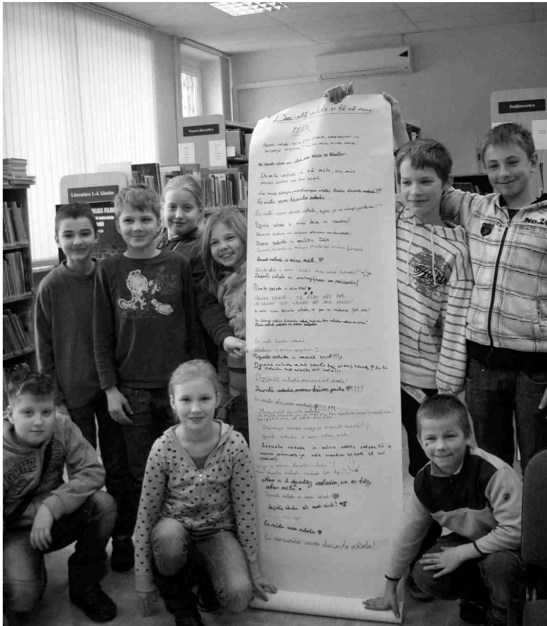
Skolēni, viņu vecāki un skolotāji pauda savu attieksmi pret dzimto valodu uz vairāku metru gara plakāta.