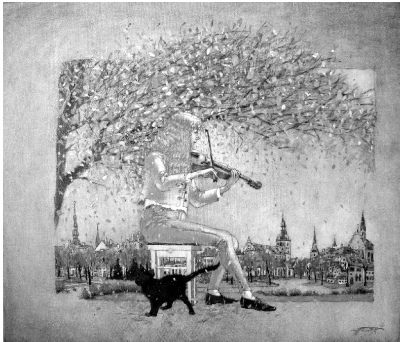
Golden Melody - zelta toņos gleznotā vijolniece, kas spēlē uz Vecrīgas fona.