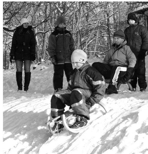
Ziemas priekus izbaudīja gan lieli, gan mazi.

Ģimeņu pasākumā «Ziemas prieki» uz Divkalniņa pulcējās un mēroja spēkiem vairākas ģimenes. Dalībnieki liklēcās starp konusiem vilka viens otru ragaviņās, centās trāpīt riņķus mērķī, sacentās, kurš ar ragaviņām aizbrauks tālāk no kalna, balvās saņemot gardumus. Lielie aktī-