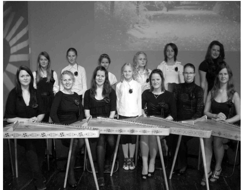
Festivāla dalībnieču vidū ir arī iecavnieces.