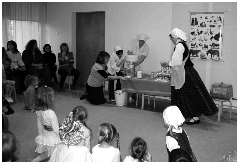
Piena nedēļā dalībnieki ieinteresēti vēroja, kā top saldais krējums.