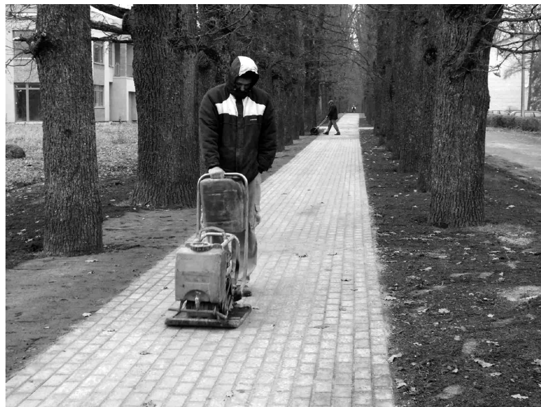
Apzaļumošanas darbus Ozolu ielas jaunizbūvētā celiņa apkārtnē uzņēmuma «V Service» darbinieki veiks pavasarī, jo šobrīd to neļauj darīt neatbilstošie laika apstākļi.

Projekta ietvaros pabeigta arī ielu un objektu norāžu uzstādīšana Iecavā un citās novada apdzīvotās vietās. Šogad realizēta projekta trešā kārtā. Pirmās ielu norādes Iecavā uzstādīja 2007. un 2008. gadā. Izvietotās norādes palīdz viegli un nepārprotami orientēties apdzīvotajās vietās gan viesiem, gan operatīvajiem dienestiem un dažādu pa-