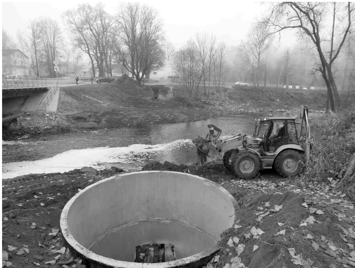
Pēc rekonstrukcijas ūdeni Dartijas mikrorajonam piegādās pa pārvadu, kas izbūvēts upes gultnē.

Viens no rekonstrukcijas sarežģītākajiem posmiem bija ūdensvada pārejas izbūve pāri Iecavas upei. Tā kā Latvijā nav daudz uzņēmumu, kas spēj veikt šādu tehnoloģiski specifisku darbu, tā veikšanai tika piesaistīts apakšuzņēmējs SIA «Jūras Vējš». Uzņēmuma speciālisti attīrīja upes gultni, izveidoja