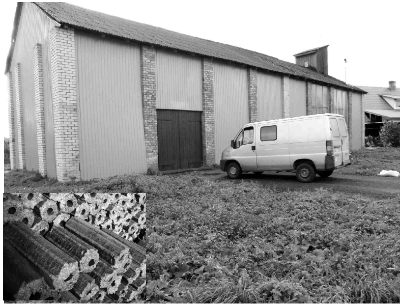
Kādreizējā zālāju kalte Vītolu ielā 42 pārtapusi par SIA «Ekopres» briķešu ražotni.

Lai izveidotu ražotni un iegādātos nepieciešamās iekārtas, uzņēmums startējis Lauku atbalsta dienesta (LAD) izsludinātajā Eiropas Lauksaimniecības fonda lauku attīstībai (ELFLA) pasākumā «Atbalsts uzņēmumu radīšanai un attīstībai». A. Ban-