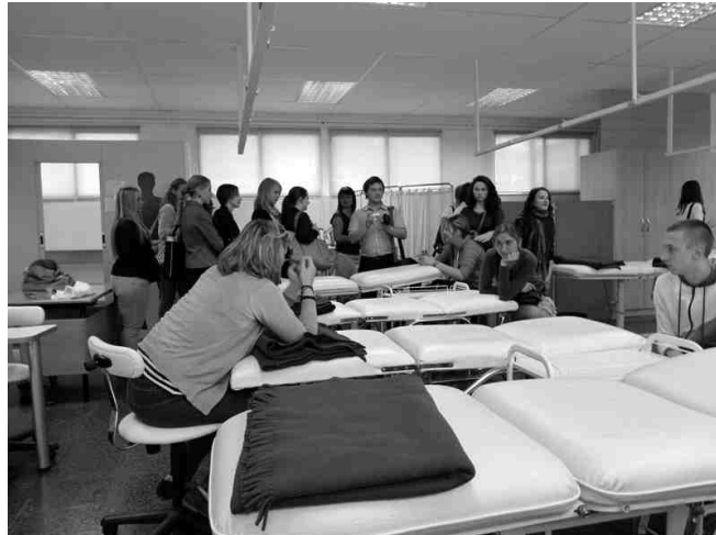
Iecavas vidusskolas partnerības skola darbojas ar profesionālu ievirzi - iecavnieki uzzināja, kā amata prasmes apgūst masieri un kosmetologi.

- Ceļojums uz Spāniju bija tiešām iespaidīgs. Spānija mums visiem bija kā otrā vasara.