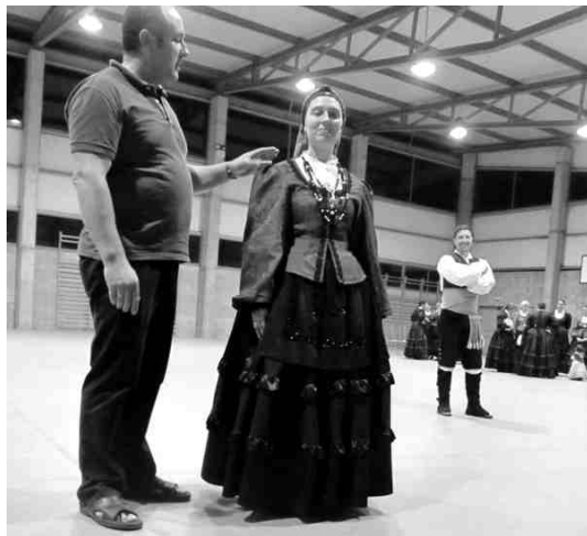
Projekta dalībniekiem bija iespēja apskatīt partneru tautas tērpus un iepazīt nelielu daļu no spāņu kultūras.

Liels paldies skolotājam Vitai, ka bija tik brīnišķīga iespēja apskatīt citu valsti. Ļoti palika atmiņā okeāns. Tas bija neaizmirstami. Tā nav vienkārši Jūrmala, kura mums ir tepat Latvijā. Tas bija lielais Atlantijas okeāns. Bija tik pasakains laiks, silti, viņi trīs metru augstumā. Nespēju aprakstīt, cik siltas atmiņas man ir no Spānijas.