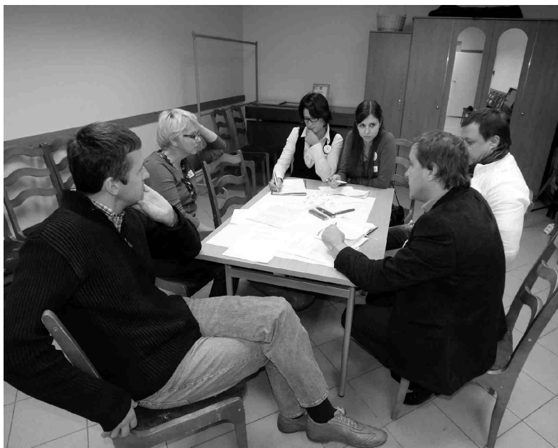
Diskusijas darba grupā, kura izstrādāja ieteikumus uzņēmējdarbības un vides aizsardzības jomā.