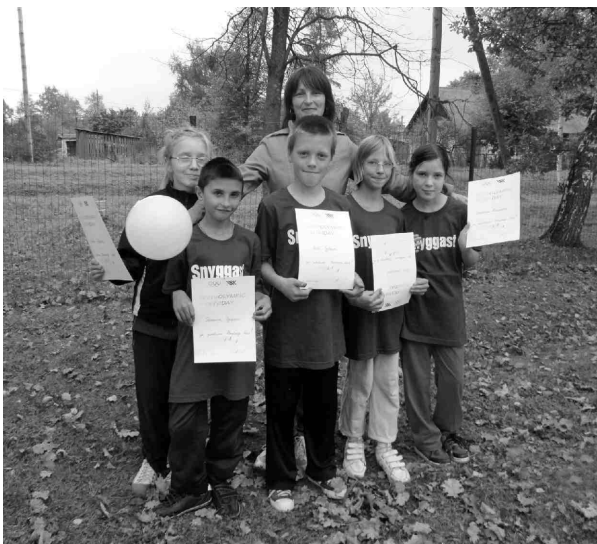
Visi Olimpiskās dienas dalībnieki saņēma diplomus un jutās kā uzvarētāji.