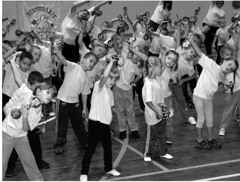
Olimpiskās dienas vismazākie dalībnieki sporta namā «Dartija» azartiski centās izpildīt rīta vingrošanas kompleksu. Vairāk fotogrāfiju skatiet www.iecava.lv/galerija .

Veiklākie stafešu skrējēji ieguva saldumu balvas no sporta skolas «Dartija». 3.-4. klašu grupā 1. vietu izcīnīja Iecavas vidusskolas 4.b klase, 2. vietu - 4.a klase, 3. vietu - 3.a klase; 5.-6. klašu grupā 1. vietu - Iecavas vidusskolas 6.c klase, 2. vietu - Dzimtmsis pamatskolas 6. klase, 3. vietu - vidusskolas 6.a klase; 7.-8. klašu grupā 1. vietu - Iecavas vidusskolas 8.b klase,