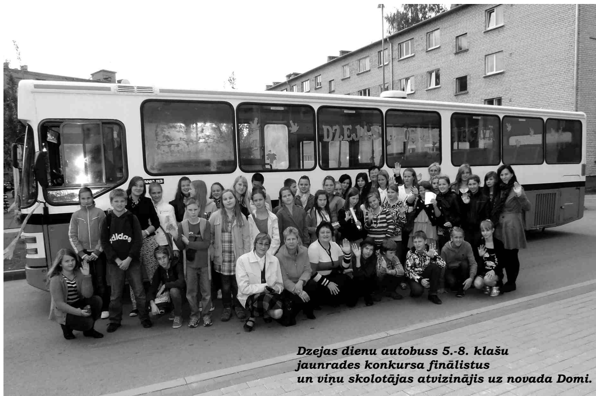
Dzejas dienu autobuss 5.-8. klašu jaunrades konkursa finālistus un viņu skolotājas atvīzinājis uz novada Domi.

Mājot ardievas upītei, Dzejas dienu dalībnieki turpināja ceļo-