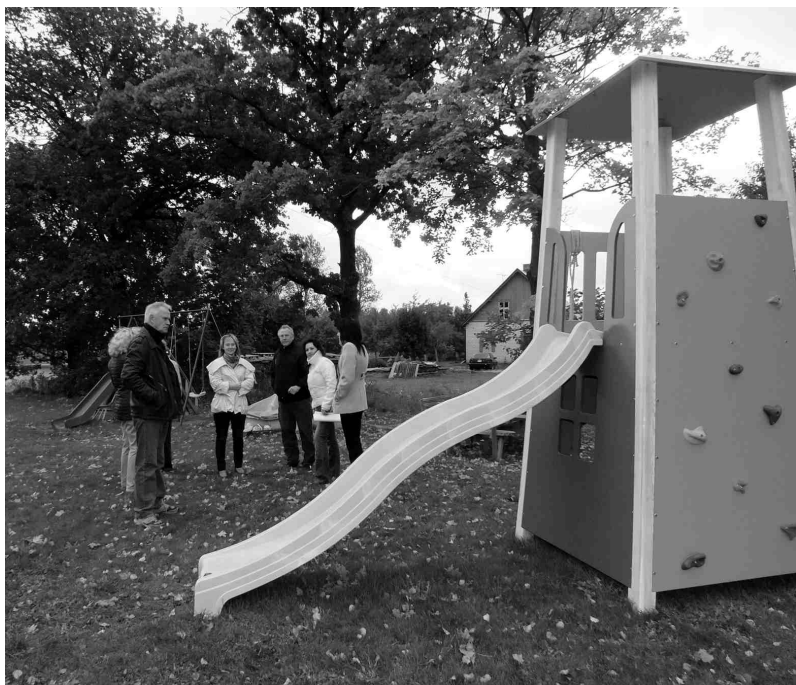
Komisija apskata bērnu rotaļu ierīci Zorģos.