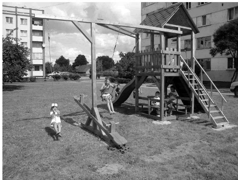
Līdz šim pie daudzdzīvokļu nama Rīgas ielā 41 bija vien smilšu kaste un novecojusi metāla konstrukcija kāpelēšanai. Tagad bērnu aktivitātes svaigā gaisā dažādo jaunā rotaļu ierīce.