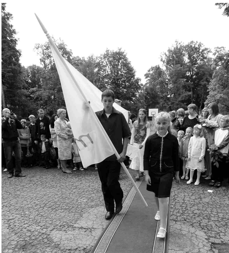
Aktīvākie vides projektu dalībnieki ienes Mammadaba Zaļo karogu, kas turpmāko gadu plīvos pie skolas ēkas.