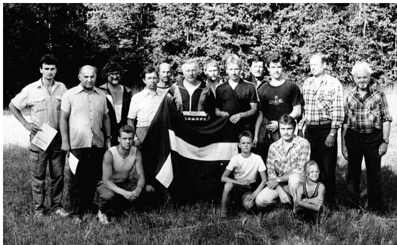
53. Bauskas kājnieku bataljona Iecavas rota 1992. gada bataljona sporta spēlēs.

No šodienas skatupunkta atskatoties uz laiku pirms 20 gadiem, jāsaka, ka vismazāk vilušies ir tie, kas neko negaidīja no valdībām, bet rīkojās paši. »