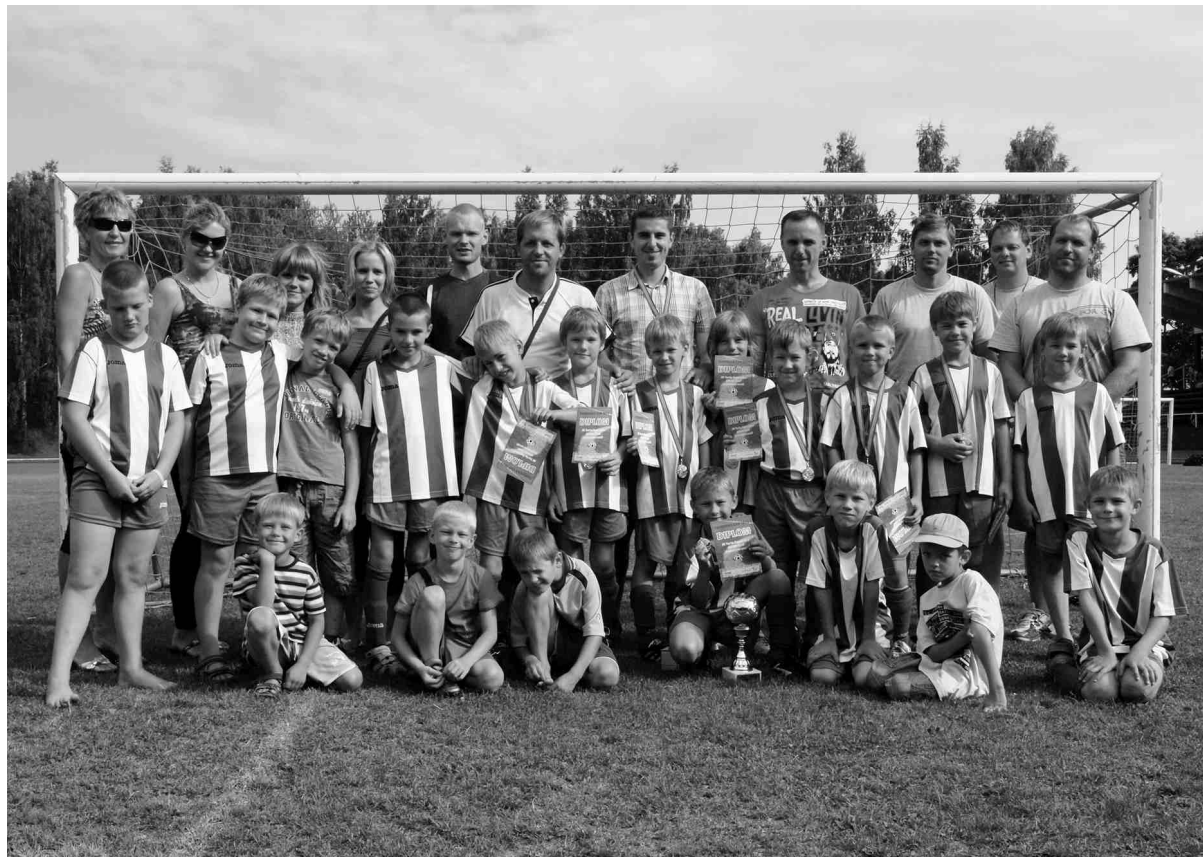
Prieks un gandarījums par veiksmīgo dalību futbola turnīrā ir visiem - gan jaunajiem futbolistiem, gan treneriem un līdzjutējiem.

Tā kā otrā diena vecākajai grupai atkal nenesa veiksmi, iecavnieki visas cerības lika uz 2003. gadā dzimušo zēnu komandu. Lielisko atbalstītāju klātbūtnē komanda rādīja lielisku futbolu, no sešām spēlēm izcīnot piecas sausas uzvaras un tikai vienu reizi piedzīvojot zau-