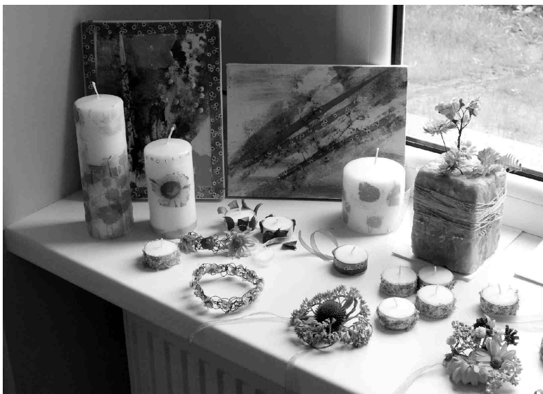
Radošo dienu dalībnieki Zorģu bibliotēku pārvērtuši par izstāžu zāli - uz palodžēm rotājas izgatavotie darbi: rokassprādzes, parafīna vāzes, izdekorētas sveces, kolāžas.

koninklijke nederlandsche heidemaatschappij