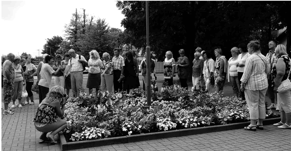
Iecavas puķu draugi Ventspils Rātslaukumā.