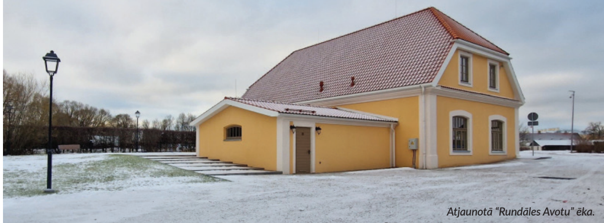
Atjaunotā "Rundāles Avotu" ēka.