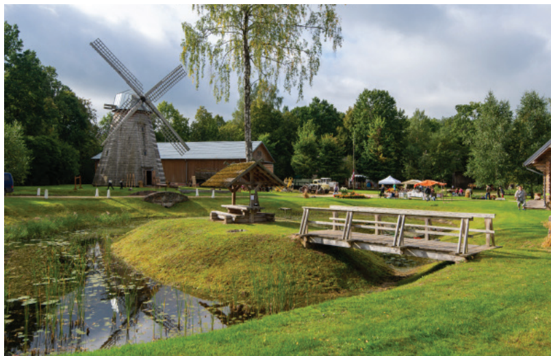
Viesu nams, atpūtas vieta un seno lauksaimniecības, mājsaimniecības priekšmetu muzejs "Ausekļu dzirnavas".