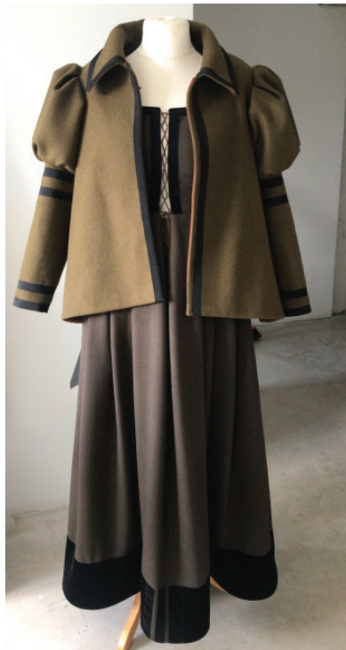
Viens no Lolitas darinātajiem tērpiem Bauskas pils muzejam.

Šūšana ir Lolitas sirdslieta kopš 13 gadu vecuma, taču profesionāls pavērsiens noticis Anglijā: "Nonācu pareizā vietā, un tas man ļāva vairākus gadus strādāt par asistenti pie viena no augstās modes dizaineriem - Stīvena Heika. Daudz iemācījos,