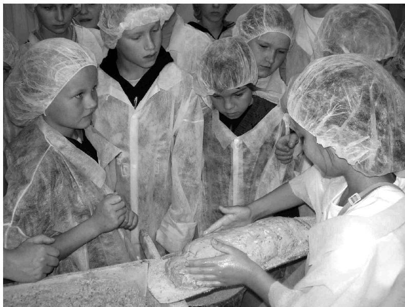
«Lāčos» gatavojam paši savu maizes klaipu.

Ar silto klaipiņu sainīti devāmies uz Ziemassvētku kauju mu-