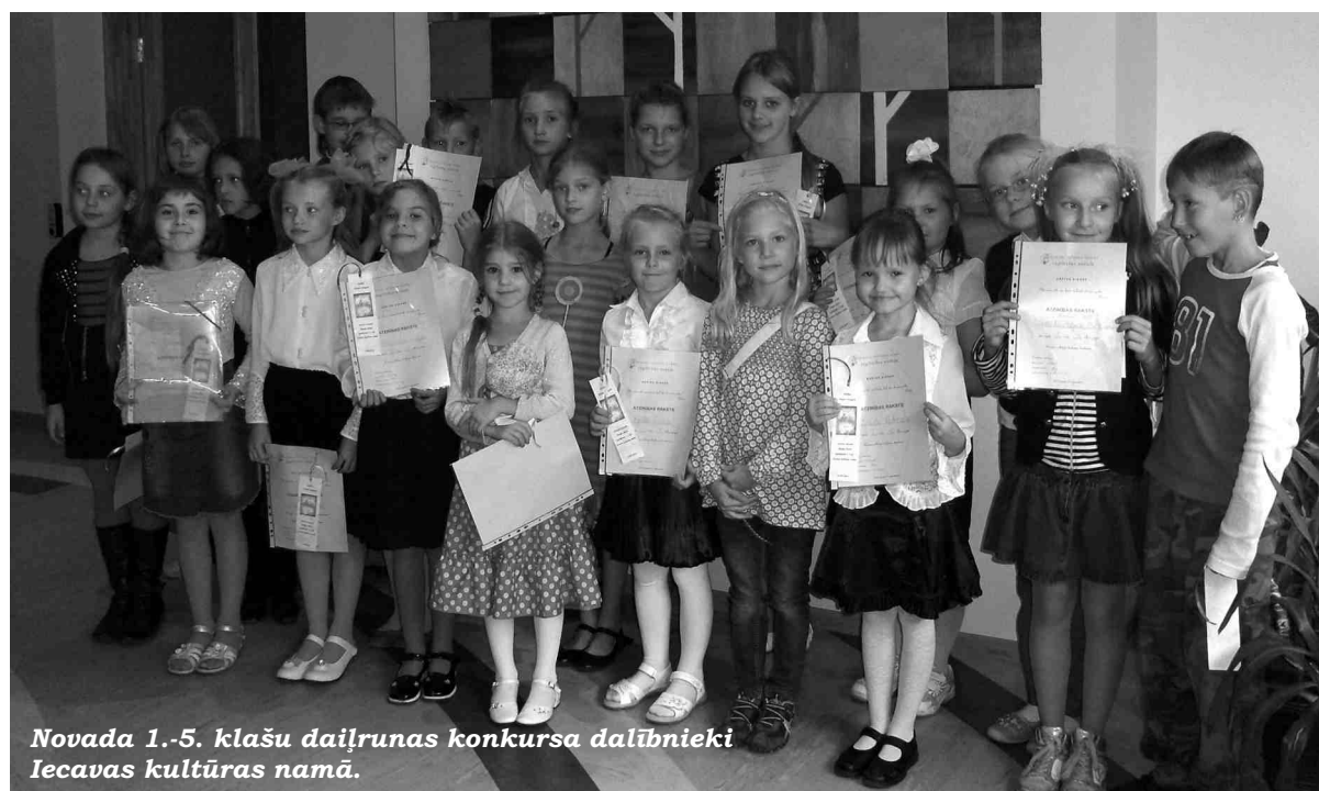
Novada 1.-5. klašu daiļrunas konkursa dalībnieki Iecavas kultūras namā.