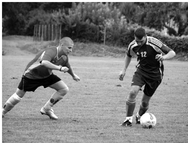
Spēle par trešo vietu.