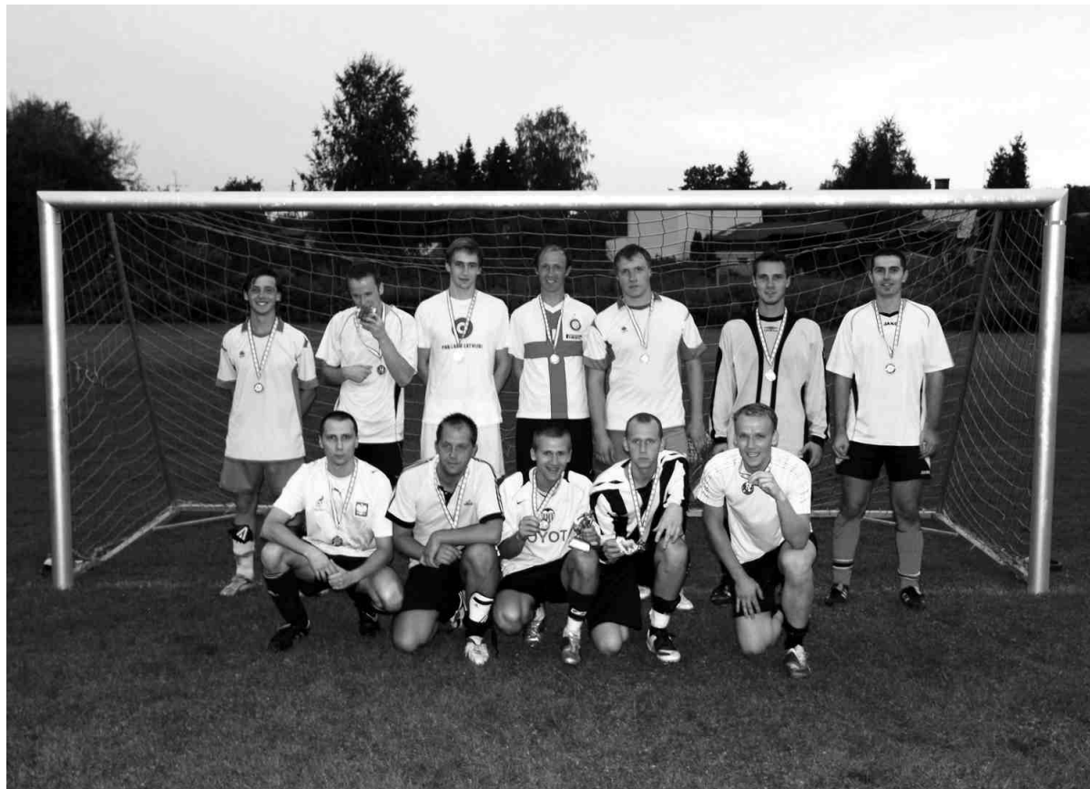
Otrās vietas ieguvēji - Ballu Motors.

Fināla spēle starp Ballu Motors un Bastions Apsardze/JFSB iznāca ļoti sīva, tāpēc pirmais