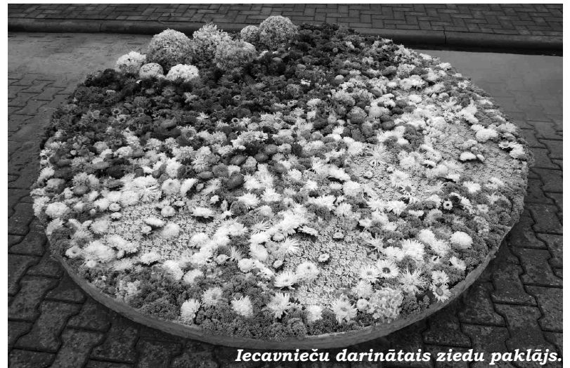
Iecavnieču darinātais ziedu paklājs.

Lielu paldies gribam teikt visiem draudzīgajiem dalībniekiem, kas konkursu padarīja par patīkamu floristu kopā sanākšanu, kā arī radiem, draugiem un uz vietas satiktajiem ventspilniekiem, kas palīdzēja ar puķu sagādi un uzmundrinājumiem. Pašas no festivāla esam guvušas lielu gandarījumu par paveikto, pieredzi un pozitīvas emocijas trīs dienu garumā.