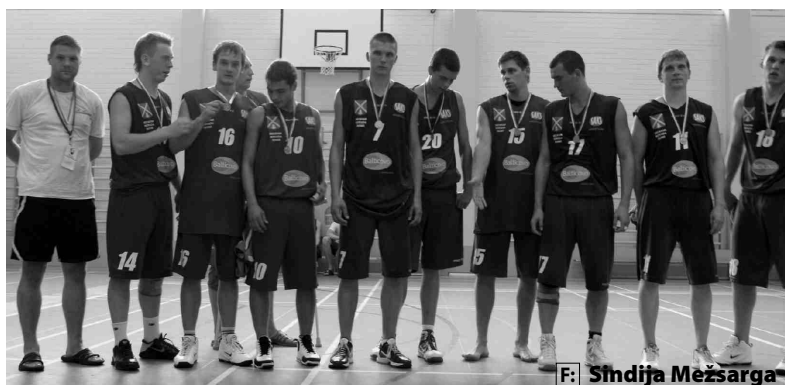
... un sporta kluba Dartija komanda.

pretinieki zaudēja iniciatīvu un, izpaliekot sīvai cīņai, iecavnieki ar rezultātu 66:41 varēja svinēt uzvaru. Sāpīgi, ka mūsu komandas divi spēlētāji turnīra gaitā guva traumas: potītes izmežģīju-